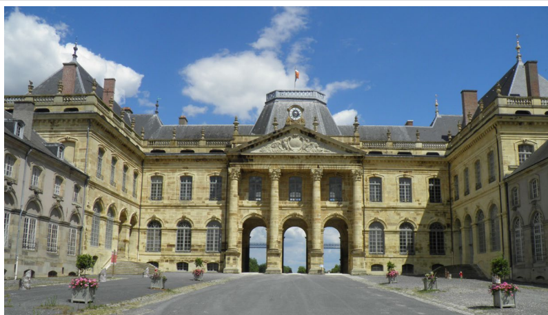
Ehrenhof von Schloss Lunéville