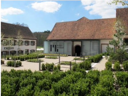
Musée Lalique, Vorplatz-Seite

Am 25.05.2024 geht es ins Bucklige Elsaß (Abfahrt per Bus voraussichtlich 08:00 Uhr am Trierer Hbf).